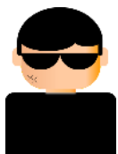
攻撃者 (A社のなりすまし)